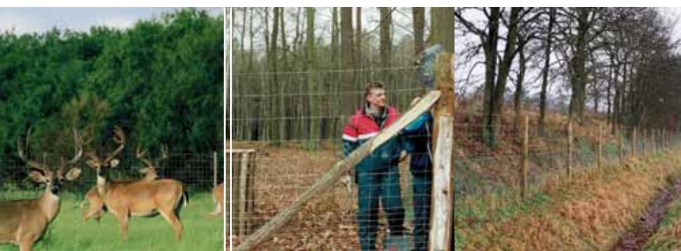
Ursus Heavy AS

Betafence NV Sales Benelux Deerlijkstraat 58A B-8550 Zwevegem BE: Tel.: +32 56 73 46 46 BE: Fax: +32 56 73 45 45 info.benelux@betafence.com www.betafence.com